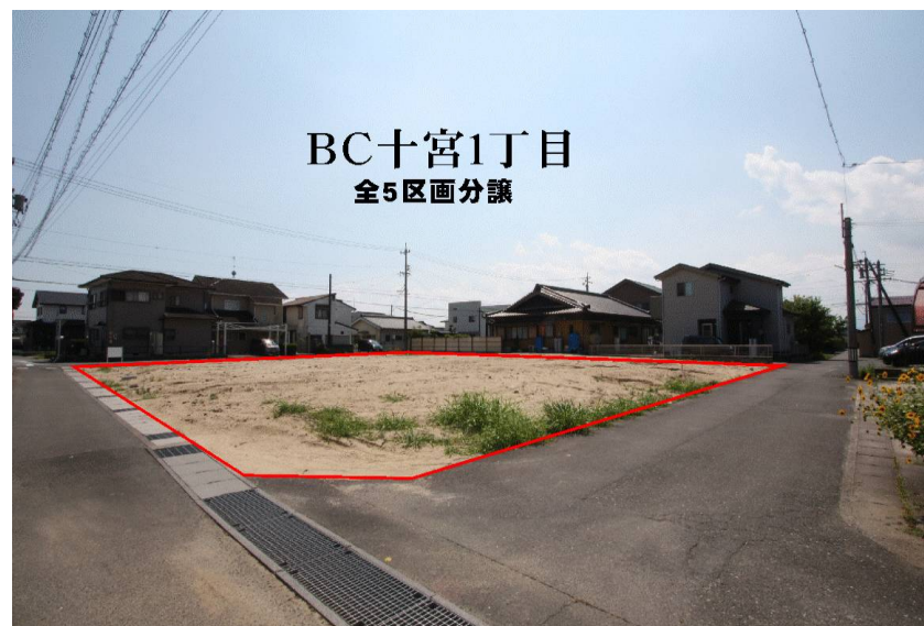
BC十宮1丁目 全5区画分譲