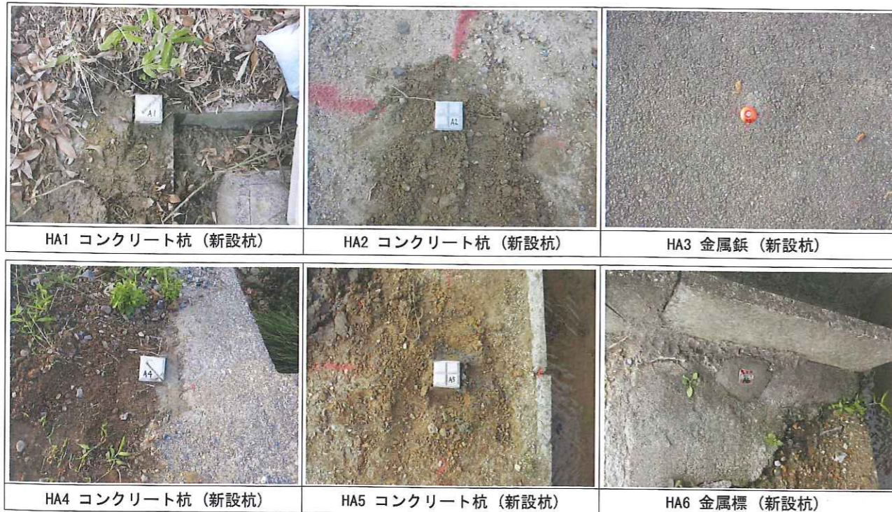
HA1 コンクリート杭 (新設杭)