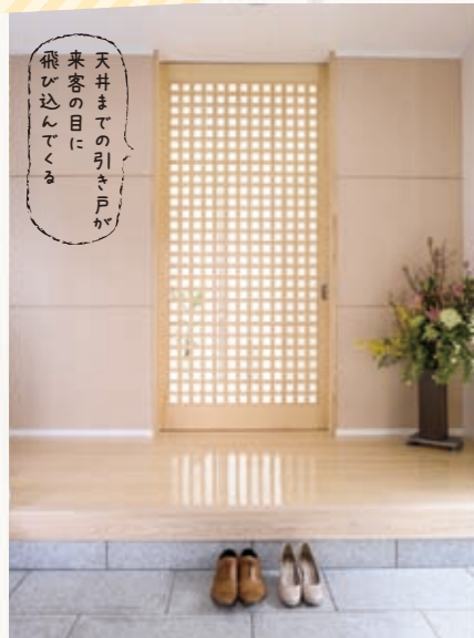
玄関ホールはひとつの部屋といえる程の広さ。それを活かす天井までの格子引き戸は圧巻。