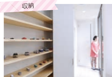
廊下に面した収納は奥行きが浅く出し入れしやすい。本やDVDをしまっておく場所にも。