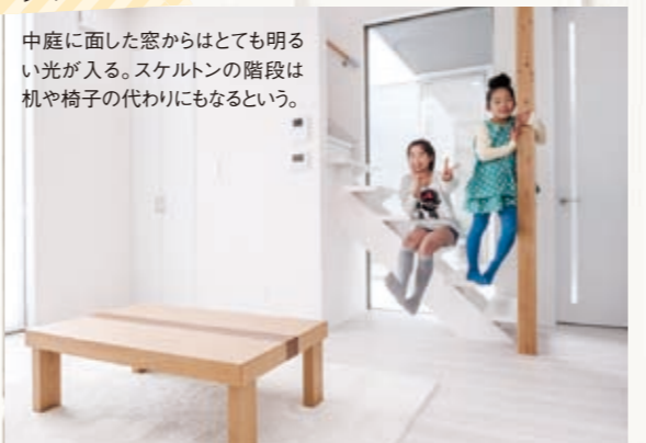
中庭に面した窓からはとても明るい光が入る。スケルトンの階段は机や椅子の代わりにもなるという。