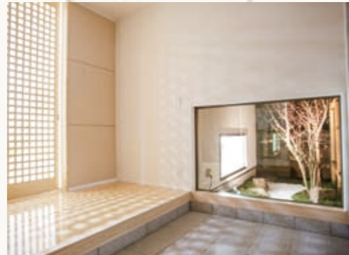
こだわりの玄関ホールは一見の価値あり 来客をうならせる玄関にしたい！という思いが詰まった玄関。大きな格子の引き戸と、窓から坪庭が見えるという趣向がポイント。