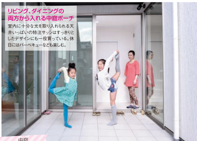
リビング、ダイニングの両方から入れる中庭ポーチ 室内に十分な光を取り入れられる天井いっばいの特注サッシはすっきりとしたデザインにも一役買っている。休日にはバーベキューなども楽しむ。