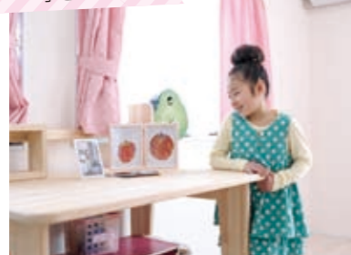
大工さんに作ってもらったという勉強机は姉妹お揃い。自分の持ち物を上手に管理する場所でもある。