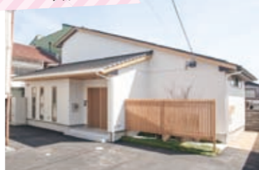
シンプルさに和風モダンの感覚を取り入れた外観 白い壁に大屋根の和風モダンな外観。坪庭部分は格子で目隠し、光は入るが視線はシャットアウトするよう配慮されている。