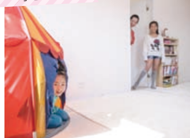
しっかりしてほしい反面、いつまでも子どもっぽさを失わずにいてほしいという願いをもつのも親の常。